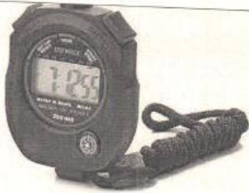
Спортивная модель часов с подвеской и антишоковой защитой