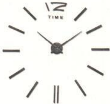
Часы, у которых циферблат без цифр, с точками или черточками вместо них