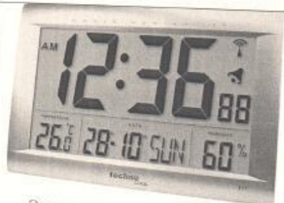
Электронные часы с множеством разнообразных функций