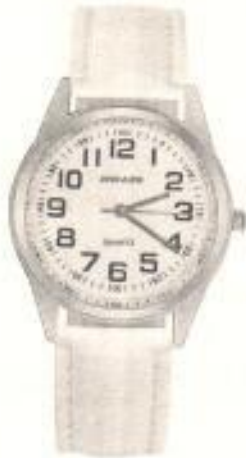
Часы классические с арабской нумерацией